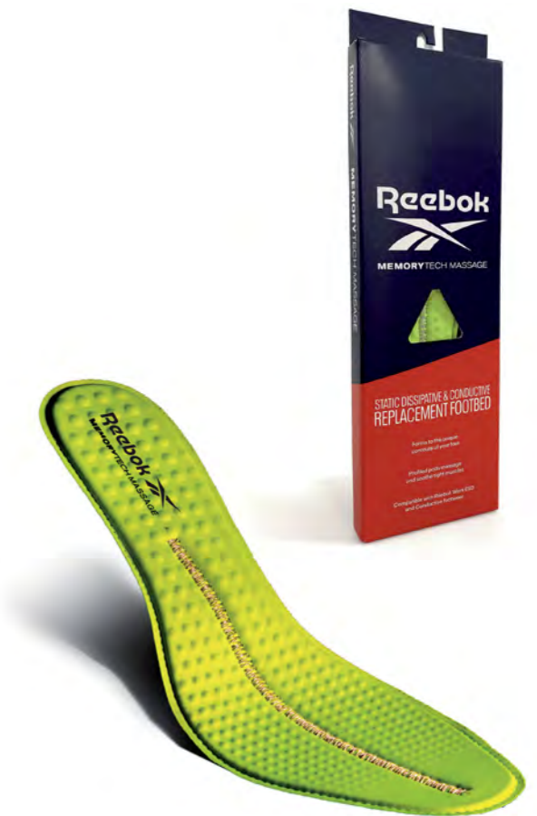
FOOTBED RBMT Removable Cushion Footbed for ESD and Conductive Footwear Fluorescent Green