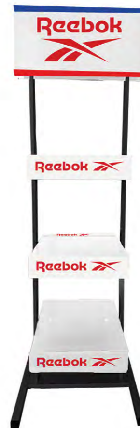
LOGO STAND EURBFS Ecofriendly Display Dimensions: 50 cm x 160 cm x 50 cm