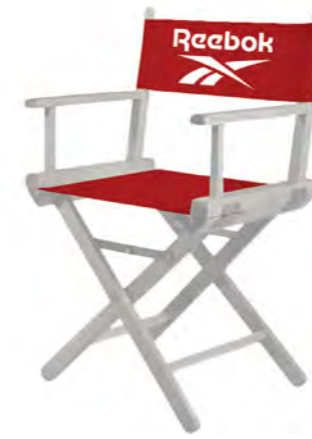
LOGO CHAIR RBCHAIR Dimensions: 49 cm x 72 cm x 34 cm