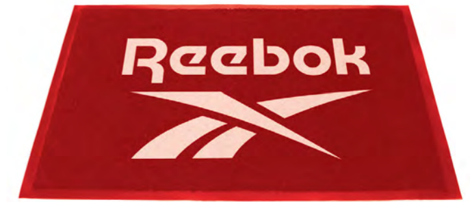
LOGO MAT RBMAT Dimensions: 60 cm x 90 cm